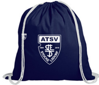
Stoffbeutel (Baumwolle): 2,00 €