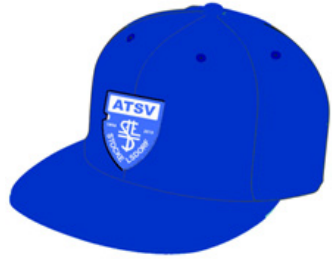
Cap: 5,00 €