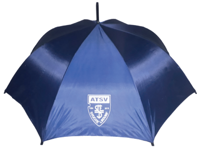
Regenschirm 6,00 €